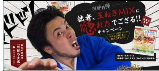
ランディングページ